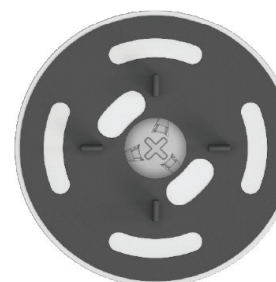
Ø 160 mm